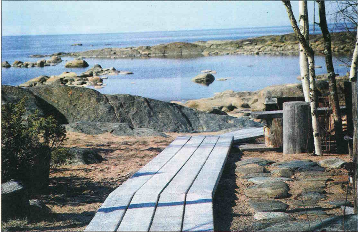
Hanhikivi-kierros jatkui pitkospuita pitkin kohti merenrantaa.

Kaikilla paikkakunnilla, jotka ovat ehdokkaina ydin-