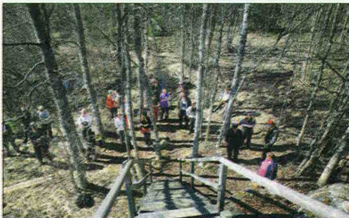
Yleisö pääsi tutustumaan Hanhikiven alueeseen lauantaina.

voimalan sijoituspaikoiksi, on esiintynyt jonkinlaista vastarintaa. Pro Hanhikivi ry ei kuitenkaan katsonut tarpeelliseksi järjestää mielenosoitusta ajamaan Pyhäjoella